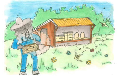
AANLEG BIJVRIENDELIJK LANDSCHAP