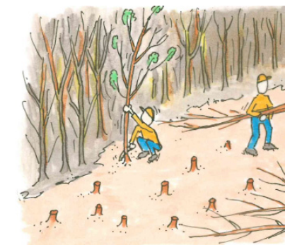
ONDERHOUD VAN HET PLANTSOEN